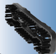
4203 Akcesorium ze szczotką 4198