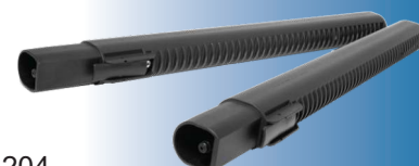
4204 Przedłużenie do pary i ssania 50 cm