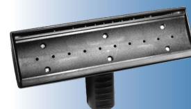
4197 Do czyszczenia szyb 23 cm