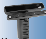
4198 Dysza pary + ssanie 14 cm