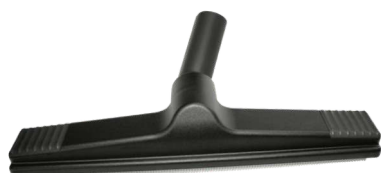
4205 Modułowe czyszczenie podłogi 40 cm