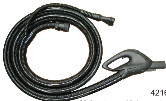
4216 Uchwyt pary/detergentu/ ssania z węzłem L = 4m