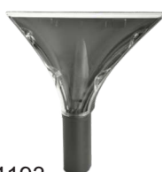
4193 Wycieraczka gumowa 23 cm