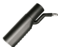
4209 Para + adapter ssący